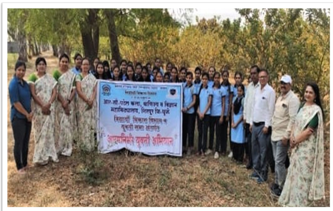
Glimpses of program