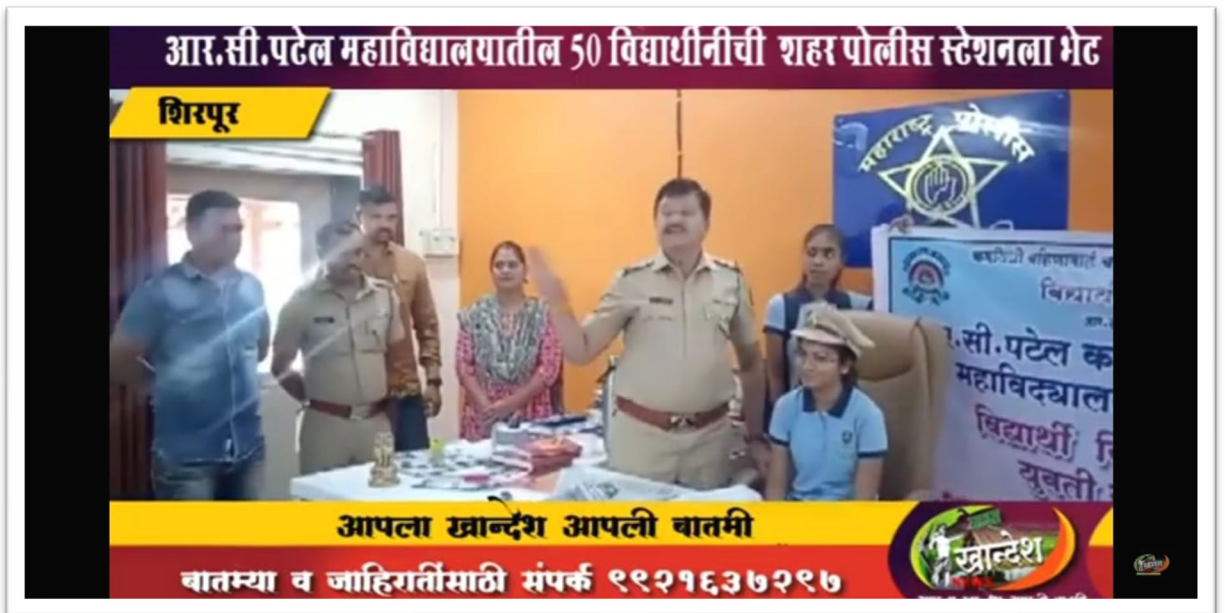
Visit to police station

3. A three-day workshop: "Navatantra Gyan Koushalya Abhiyan".