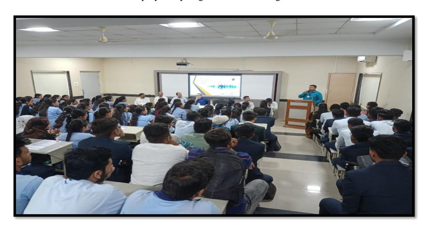
HR Team Pre-Placement Talk