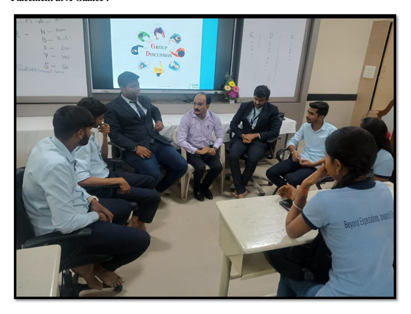
Group Discussion activity