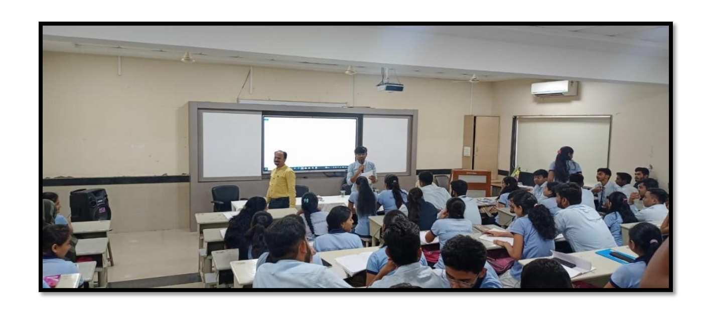
Students in Employability English Skills Training with Trainer