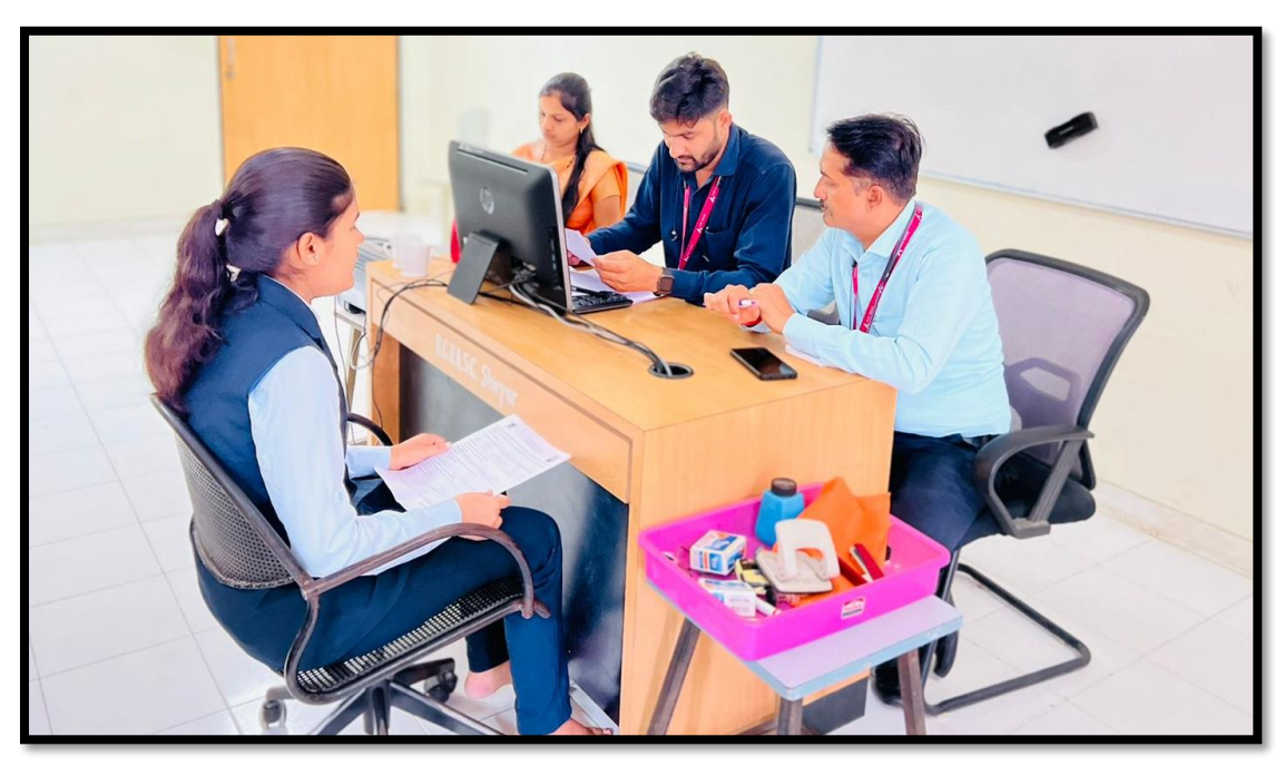
Interview Process for the Axis Bank Pvt. Ltd.