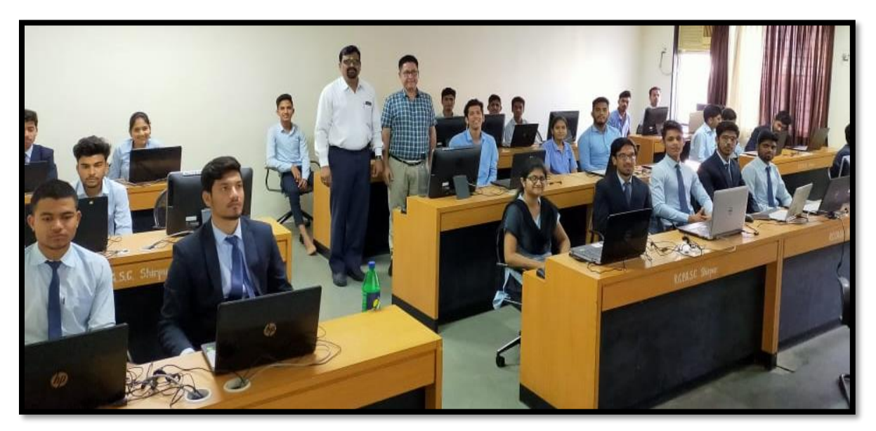
Students Appear for Aptitude test For TCS