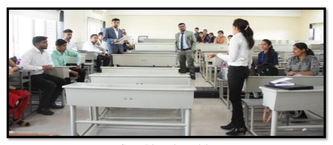
Group Discussion activity