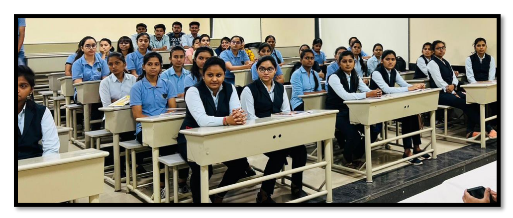
Students attempted Placement Drive for Teleperformance Pvt. Ltd.