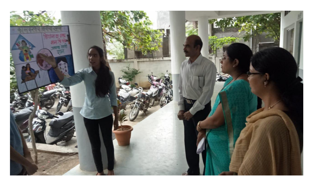
Awareness through Poster Presentation