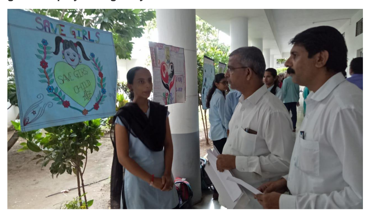
Awareness through Poster Presentation