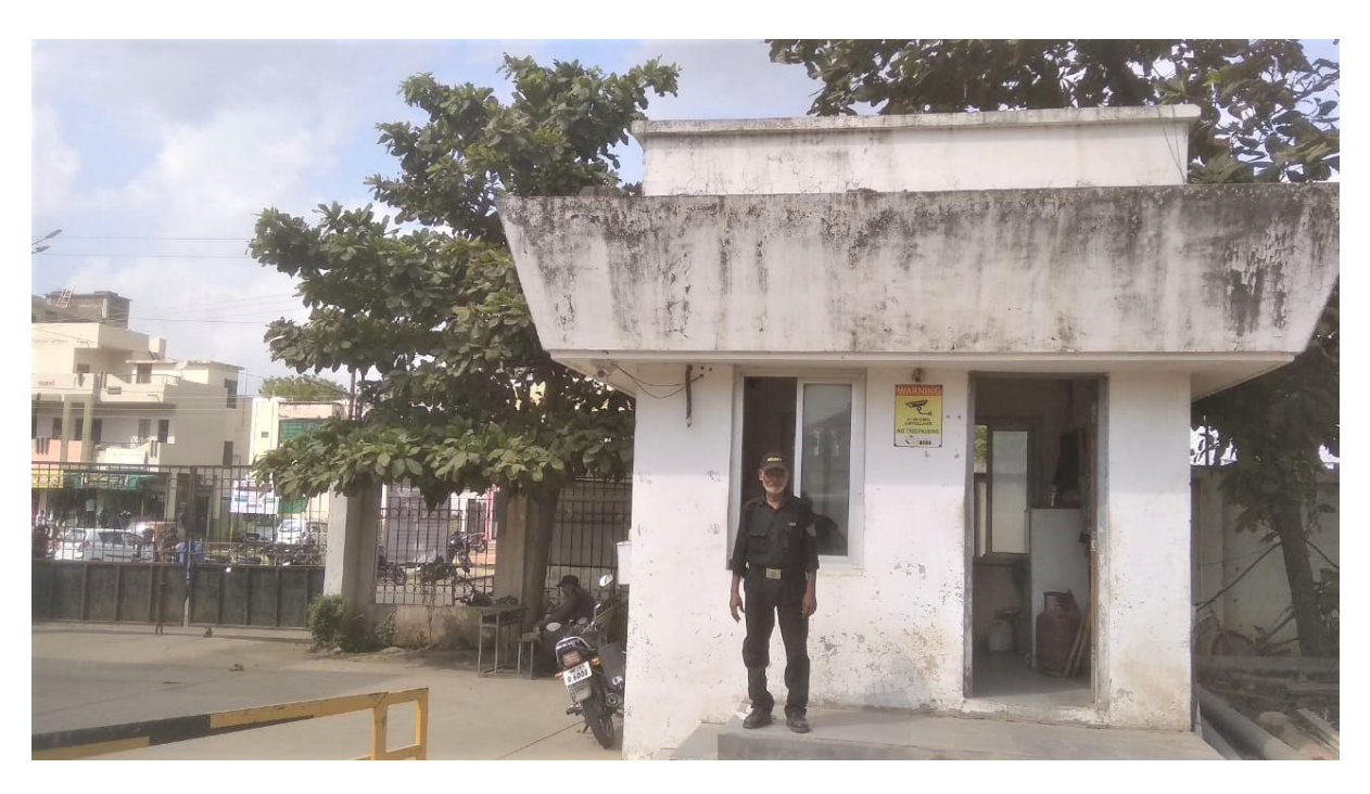
Security agency for 24/7