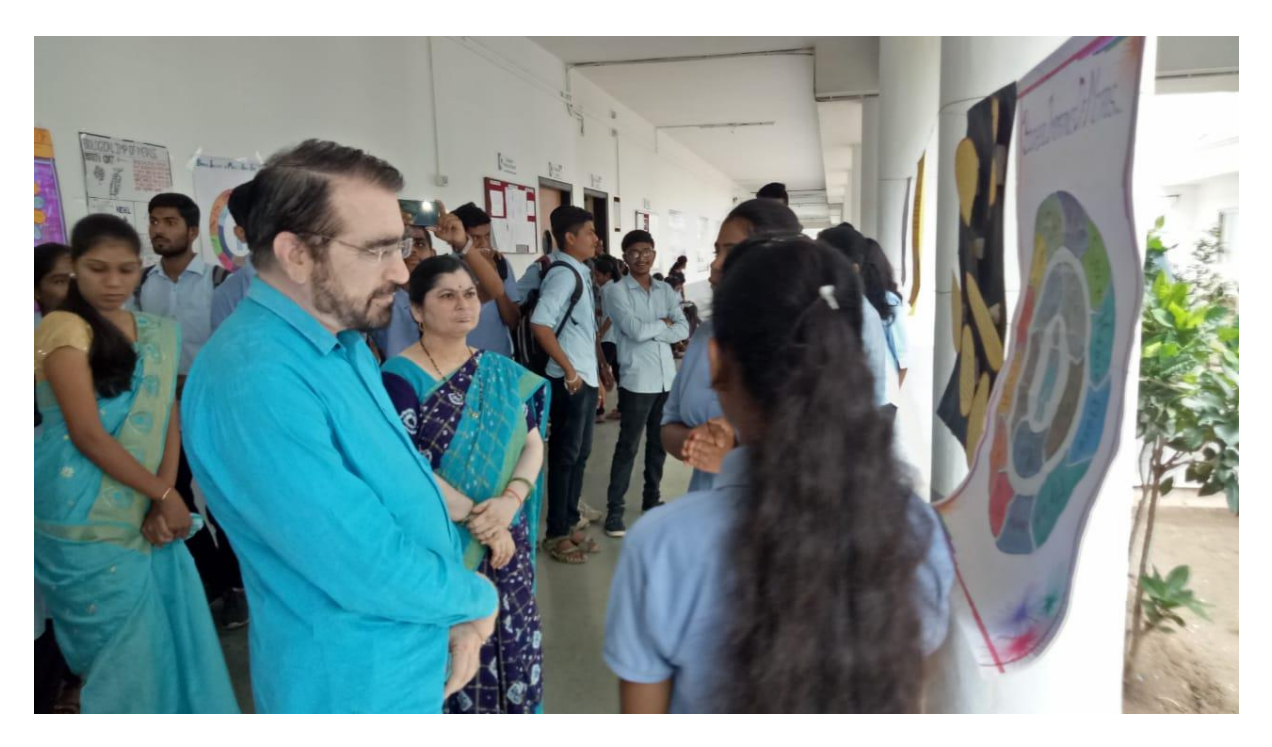
Awareness through Poster Presentation